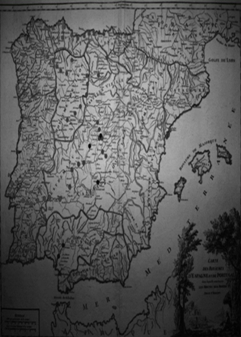
CARTE DES ROYAUMES D'ESPAGNE et de PORTUGAL par M. de la Harpe Paris chez M. de la Harpe 1750

Échelle de 100 lieues françoises ou de 125000 toises françoises à l'échelle de la carte